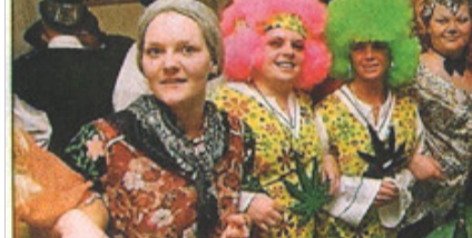
Gute beendet: gemeinsam beim Schlusslied.