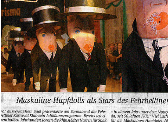
Gut mitgemacht: Die Narren ließen sich von Programm anstecken.

vor ausverkauftem Saal präsentierte am Sonnabend der Fehrbelliner Karneval Klub sein Jubiläumsprogramm. Bereits seit einem halben Jahrhundert sorgen die Rhinstädter Narren für Spaß - in diesem Jahr unter dem Motto „Gestern, heute, morgen dicke da, seit 50 Jahren FKK!“ Viel Lachen und Beifall gab's wiederum für die Maskulinen Hupfdolls. (Seite 4)