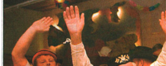
Gut gelaunt: Das Publikum verbreitete ordentlich Stimmung.