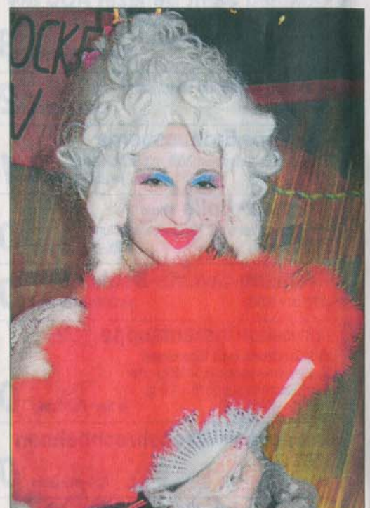
Diese Dame aus Neuruppin zeigte höfische Mode und Sinn für zeitlose Schönheit.

später inne Politik gehen“, sagte sie. Nachdem die Lachmuskeln der Gäste überstrapaziert waren, lockerten sie sich bei der nächsten Tanzrunde. „Ich kriege Gänsehaut, wenn ich die volle Tanzfläche sehe“, sagte DJ Tomas Sagner.