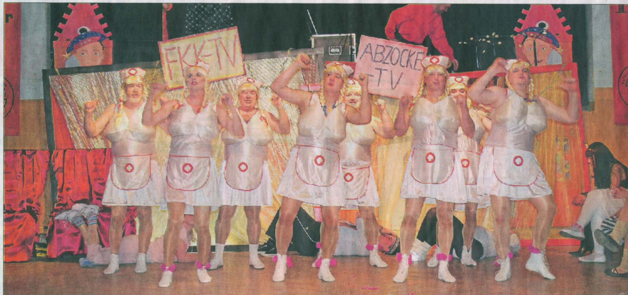
Das Männerballett des Fehrbelliner Karnevalklubs präsentierte sich zum Saisonstart in die fünfte Jahreszeit im neuen Outfit. Die maskulinen Knetschwestern demonstrierten nach einem Tänzchen anschaulich, wie man(n) Erste Hilfe bei Gliederschmerzen auch skurril behandeln kann.