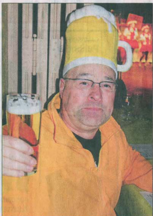
Kein Ei auf dem Kopf, sondern ein kühles Blondes. Dazu gab es ein Frisches vom Hahn.